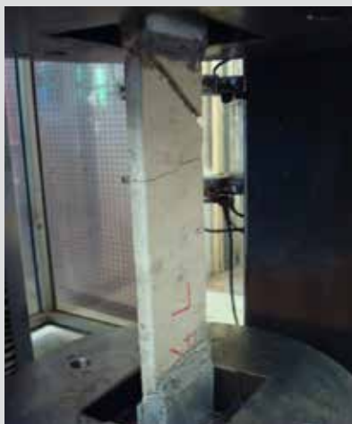
Fig. 1 Test di trazione

CONCRETE ROCK S-S1 malte a reattività pozzolanica (conforme UNI EN 1504-3 classe R2).