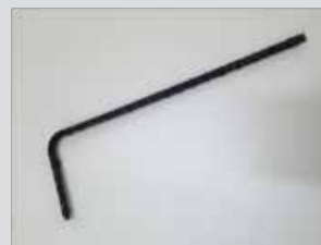
Connettore RG-FIX 10